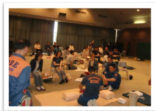
救急救命士インストラクター養成講習会 24時間（3日間）